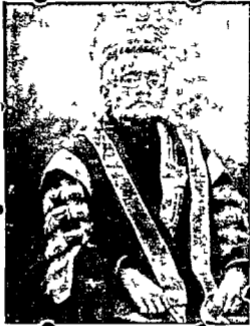
म० म० डाक्टर गङ्गानाथ झा, प्रिंसिपल, गवर्नमेंट संस्कृत कालेज, बनारस १९१८-१९२३